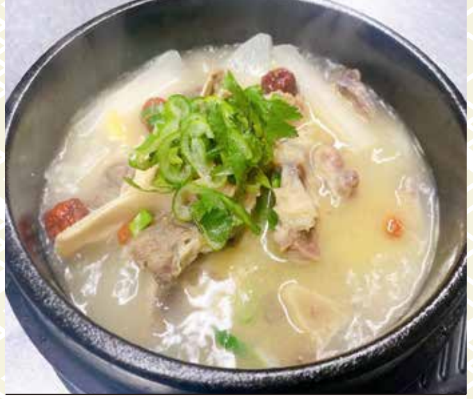
牛尾湯 1,580 円