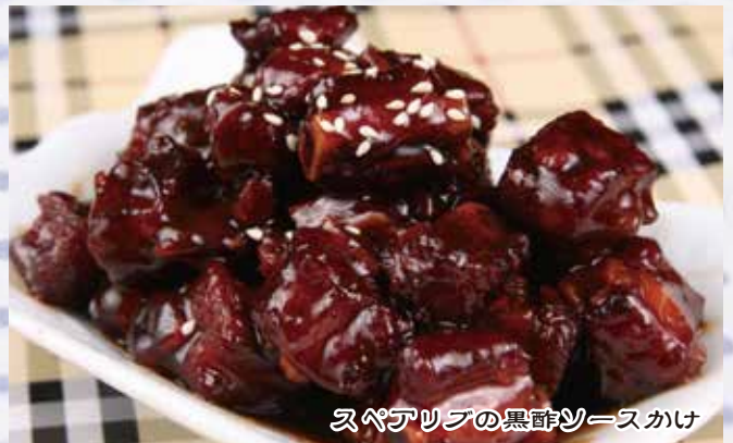
スペアリブの黒酢ソースかけ