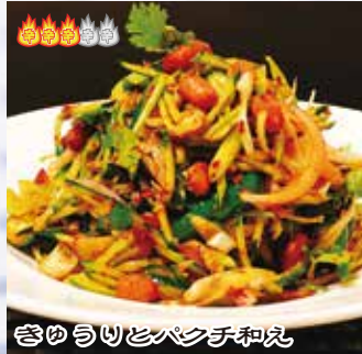
きゅうりとバンチ和え