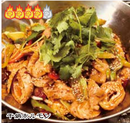
干鍋肥腸 1,680 円