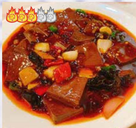
鴨血 1,580 円