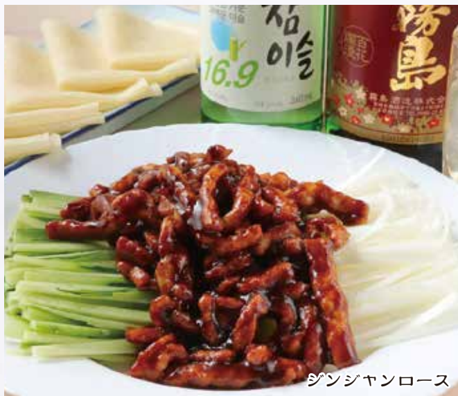
京酱肉丝 1,480 円