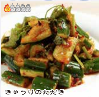
きゅうりのだだき