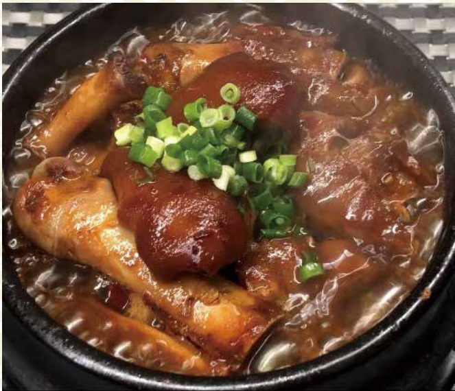
石鍋豚足 980 円