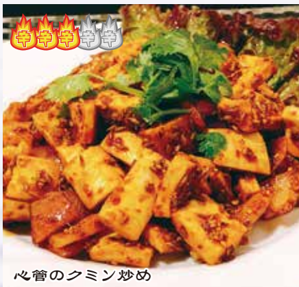
孜然血管 1,380 円