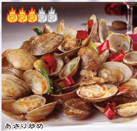
四川炒贝 1,080 円