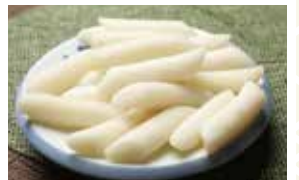
もち 300円 (10個)