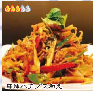
麻辣ハチノス和え