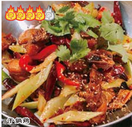
干鍋鶏 1,680 円