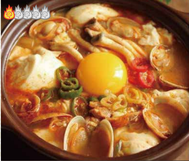
純豆腐チゲ 980 円