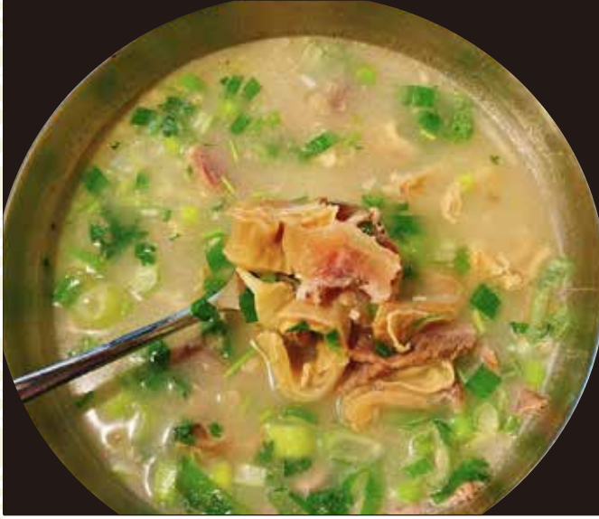
牛肉湯 1,100 円