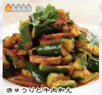
きゅうりと牛肉和え