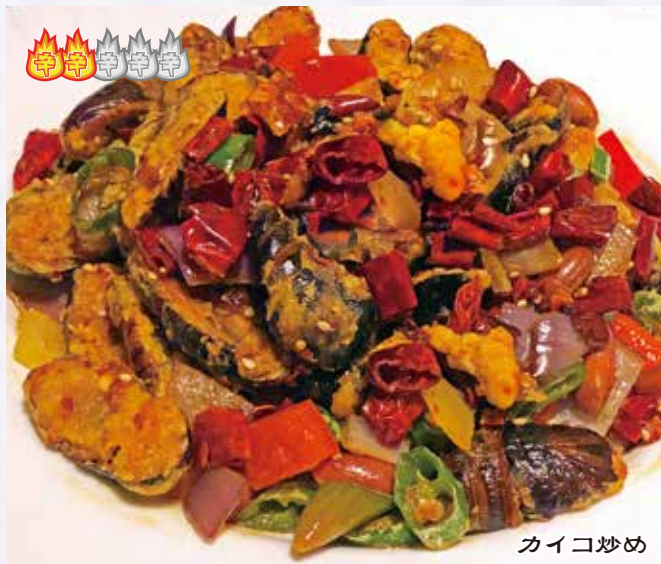
干煸蚕蛹 1,180 円