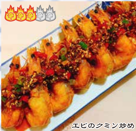
孜然虾 1,580 円