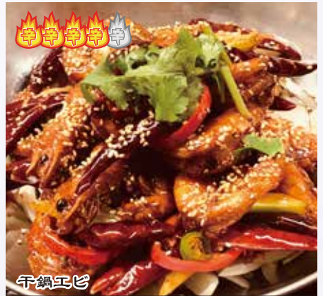
干鍋蝦 1,680 円