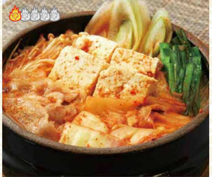
キムチチゲ 980 円