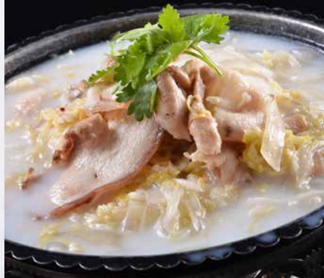
汆白肉（酸菜汤） 1,580 円