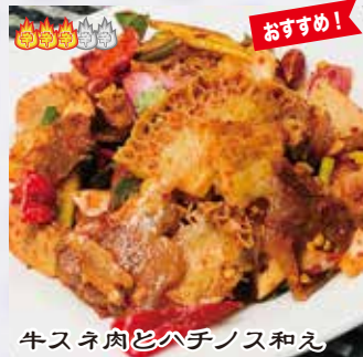
牛スネ肉とバチノス和え