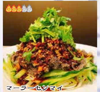
マールーセンマイ