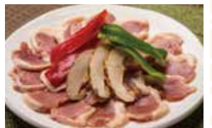
鴨肉 1,680円 (1人前)