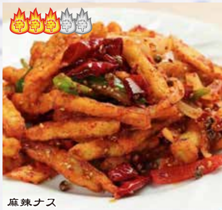
麻辣茄条 980 円