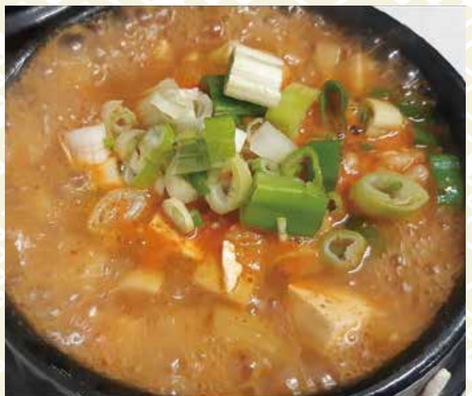
味噌チゲ 980 円