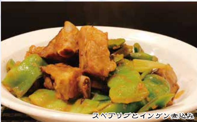
スペアリブとインゲン煮込み