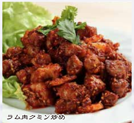
孜然羊肉 1,480 円