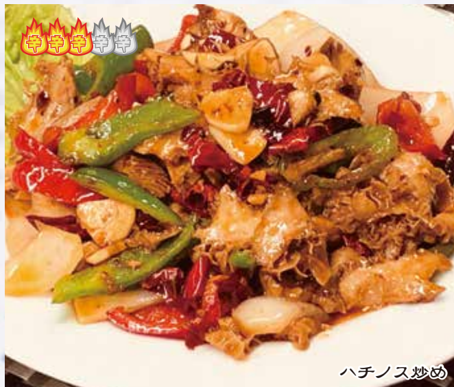
炒牛肚 1,380 円