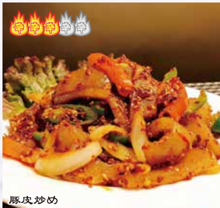
炒猪皮 880 円