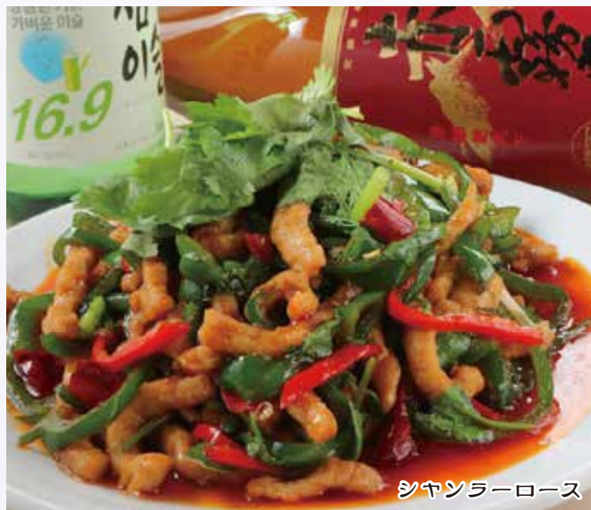
香辣肉丝 1,380 円