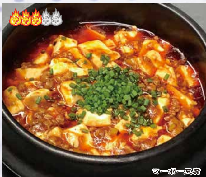
麻婆豆腐 980 円