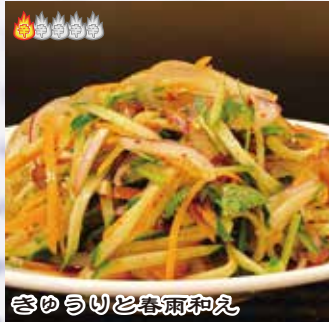
きゅうりと春雨和え