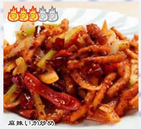
炒鱿鱼 1,080 円