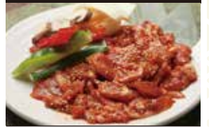
味付け鴨肉 1,680円 (1人前)